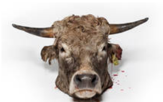
Julia Unkel, Im Angesicht, www.guteaussichten.org